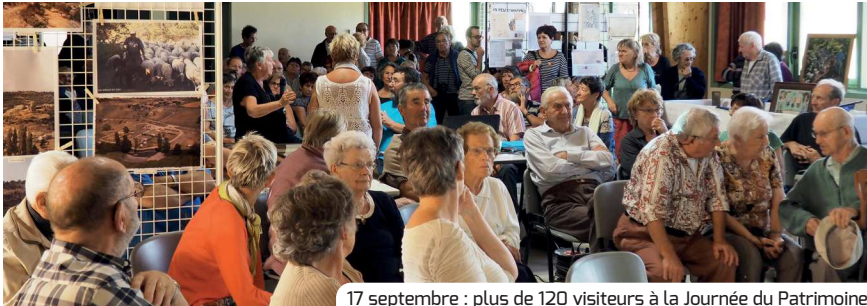
17 septembre : plus de 120 visiteurs à la Journée du Patrimoine.

Comité de rédaction : Camille Feller, Violette Raffi-Mottier, Nicolas Mezzasalma / Maquette : Françoise Borel-Pinatel / Novembre 2016