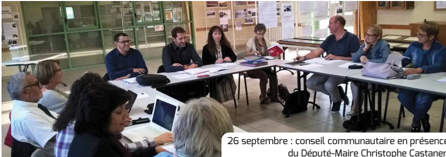
26 septembre : conseil communautaire en présence du Député-Maire Christophe Castaner.