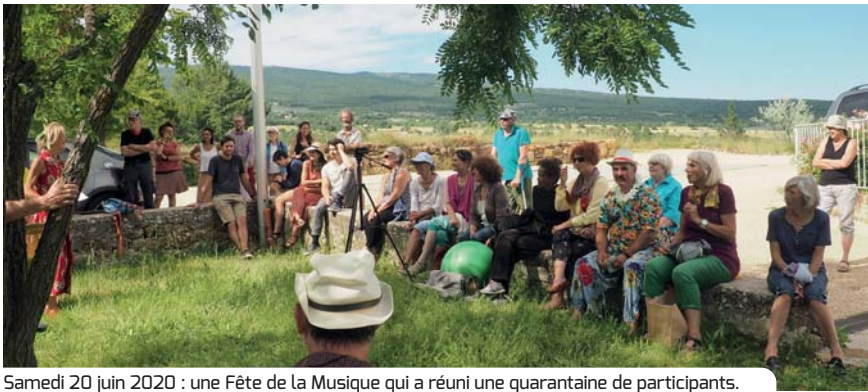
Samedi 20 juin 2020 : une Fête de la Musique qui a réuni une quarantaine de participants.