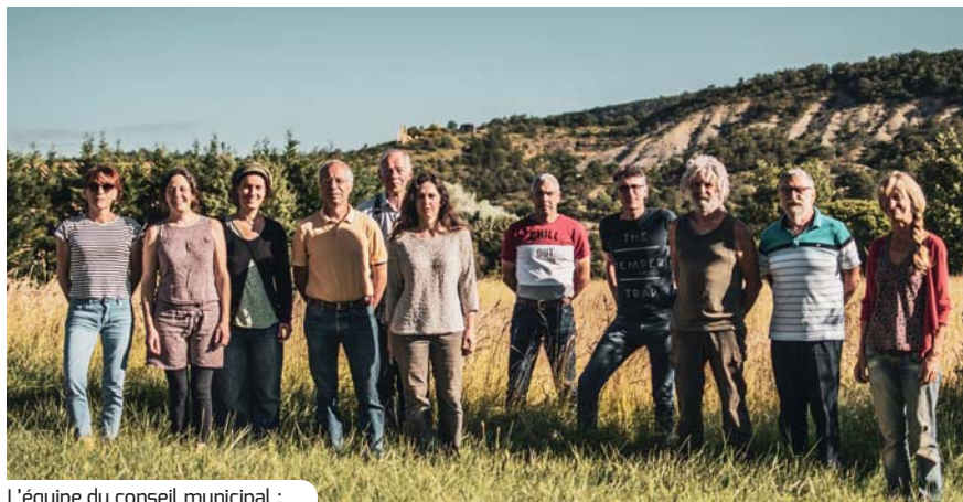
L'équipe du conseil municipal :